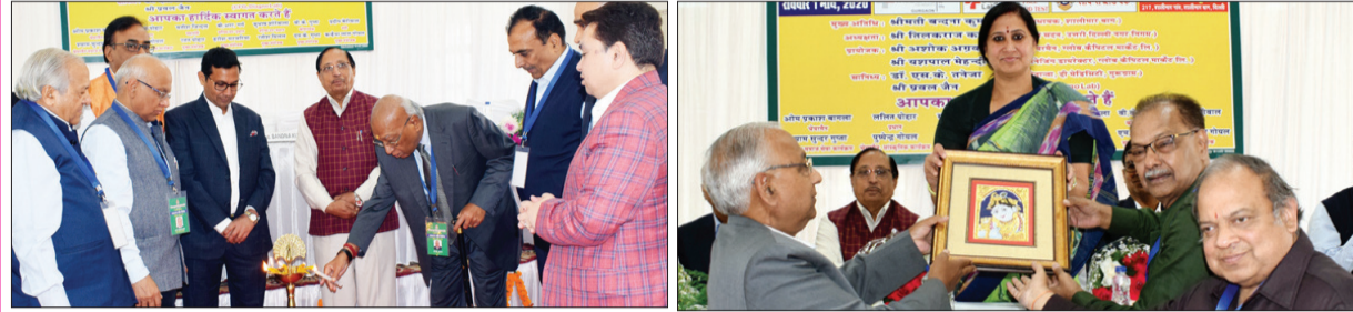
श्री राम कृष्ण सेवा संस्थान एवं ग्लोब कैपिटल फाउंडेशन द्वारा आयोजित हैल्थ कैम्प एवं रक्तदान शिविर की झलकियां।